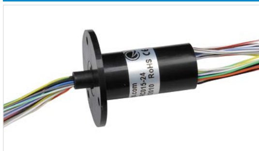
标准型(Standard Type) SRC015A-24